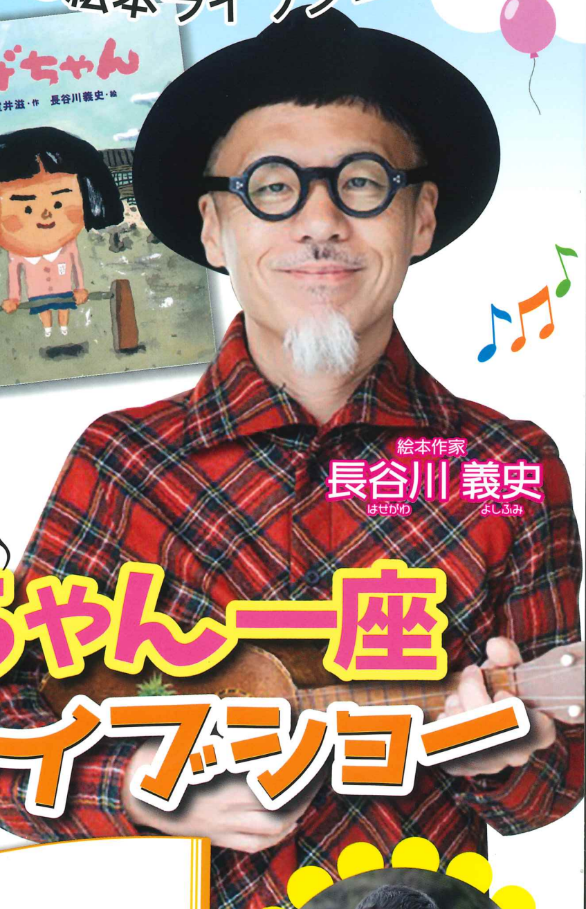
絵本作家 長谷川 義史 はせがわ よしのり