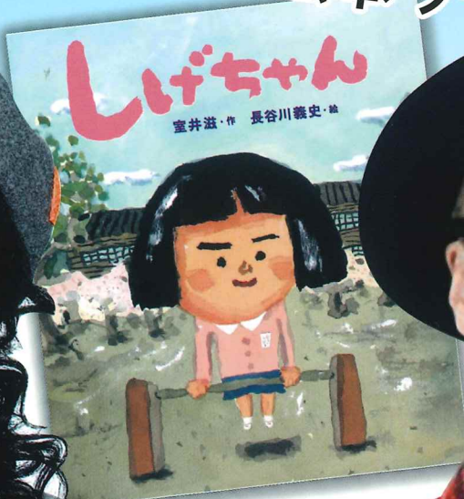
室井 滋・作 長谷川 義史・絵