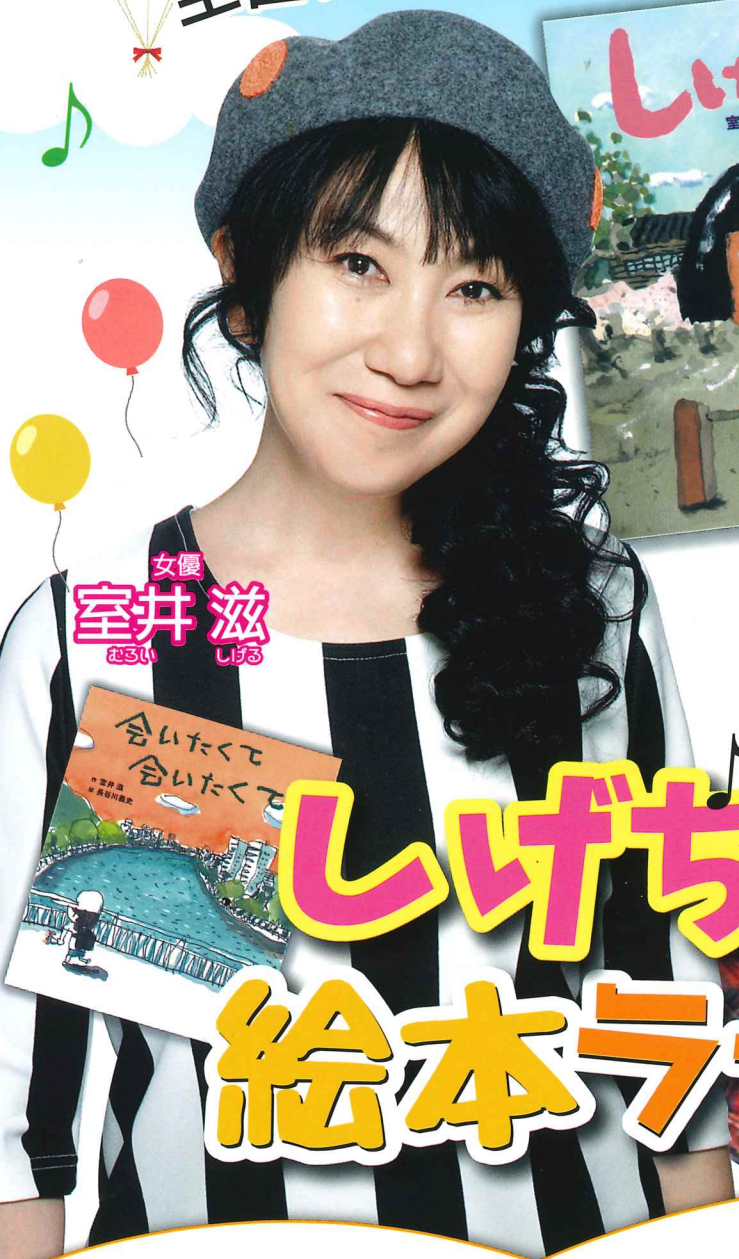
女優 室井 滋 むろい しほ