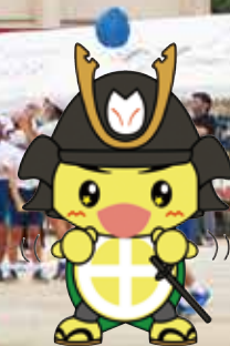
日置市イメージキャラクター 「ひおきくん」