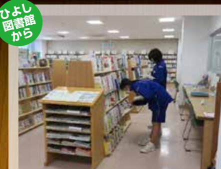
5月11日・12日に、ひよし図書館で日吉学園8年生の2人が職場体験に来ました。本の片づけやカウンター業務、ポップ作りなど、図書館の仕事は多岐にわたりますが、一生懸命頑張っていました。