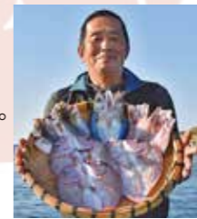
▲送り元の吹上町漁協