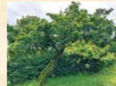
▲山崎邸の大きな梅の木

てのお話です。吉利の家にある大きな梅の木に、とても多くの実がなりました。私は梅の収穫をしたことがなかったため、吉利で食品加工や調理を行うナンデンファームの方々に手伝っていただき、優しく楽しく教えていただきながらたくさん収穫しました。その量、なんと40キロ！ 家族で消費しきれない分はナンデンファームさんに加工していただくことにしました。もう少ししたら、吉利物産店で山崎宅の梅を使ったスッパイ商品が販売されるかも!? 鹿児島に移住して約1年経ちました。あつという間でしたが初めて体験することばかりの1年でした。まだまだ知らないコト、モノが山ほどです。もっともっと地域との交流を増やして知識や技術を増やしていきたいと思っています！ 見かけたら気軽に声をかけてください。よしとし軍議場でもお待ちしておりますので気軽に足を運んでいただけると嬉しいです。