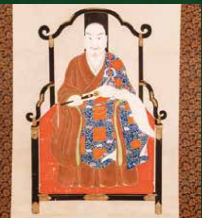
島津貴久肖像画 (尚古集成館蔵)