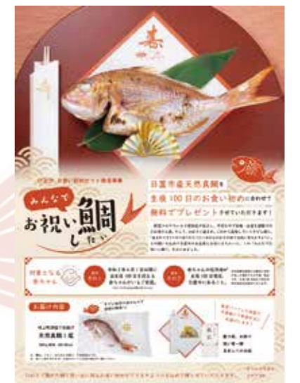
▲日置市産天然真鯛 ※写真の笹の葉と盆はセット内容に含まれません。

【申込み・お問い合わせ先】 本庁農林水産課林務水産係 ☎ 273-8870 メールアドレス iwai-tai@city.hioki.lg.jp