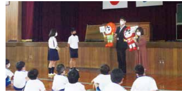
人権イメージキャラクターまなぶ君とあゆみちゃんのマスコット贈呈

「人権の花運動」は、児童が花の種を協力し合って育てることを通して、互いに協力しながら感謝することの大切さや、生命の尊さを実感する中で、人権尊重の思想を育むことを目的として、全国の小学校で実施されます。各校6年に1度実施し、日置市では今年、東市来地域の鶴丸小学校、伊作田小学校、吹上地域の伊作小学校の3校で実施されます。伊作小学校では「花を育てる活動を通して、感謝したりすることのできる人になれるよう努力していきたいと思います」と代表の児童が抱負を語りました。