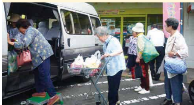
平成28年度コミュニティバス運行計画

この取組みは、高齢者の生きがいつくりや見守り活動の役割も兼ねておりますが、今後はこうした取組みから発展して、地域が主体となって運行する「地域内公共交通」の検討も考えられるところです。