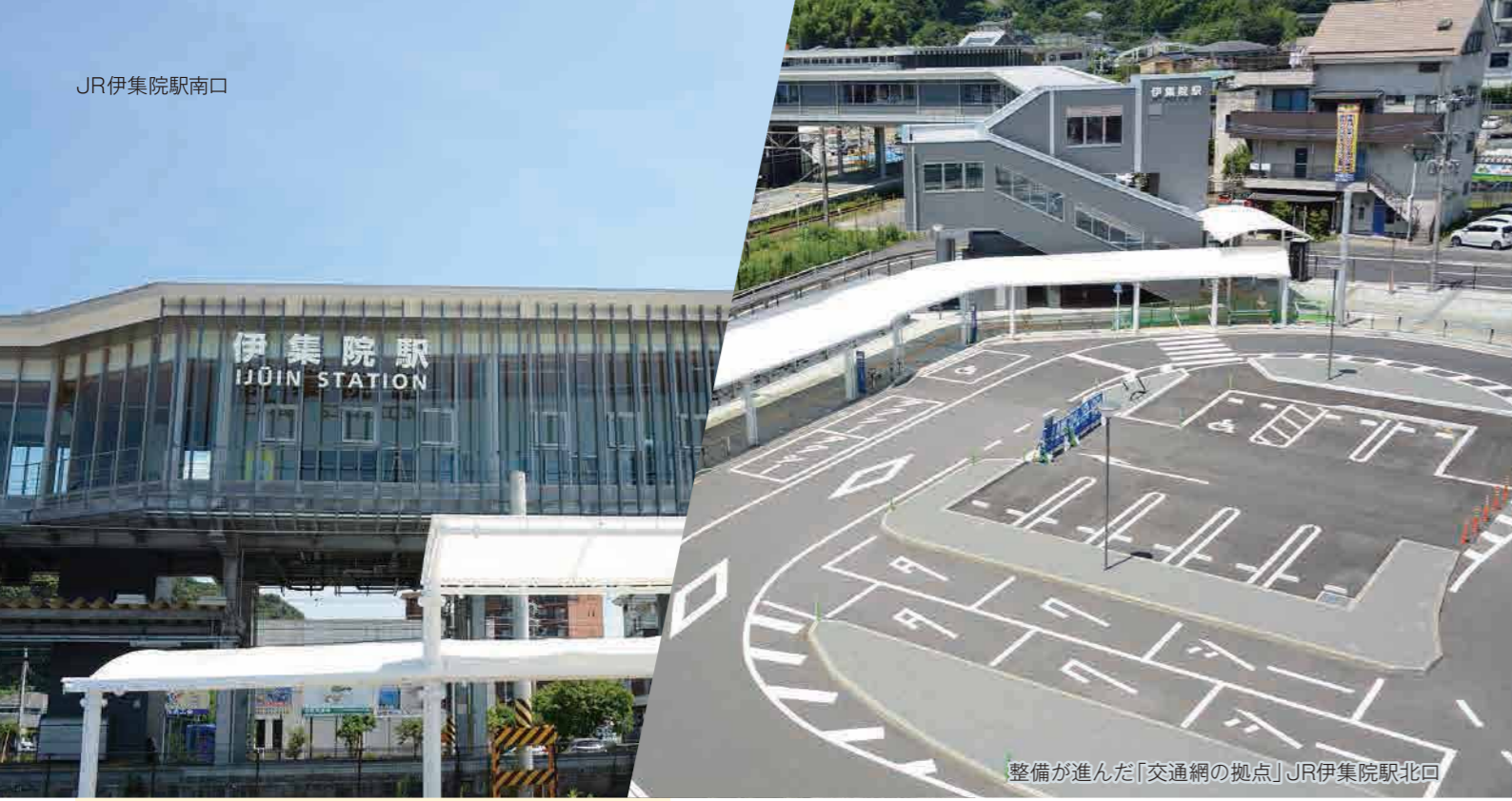
整備が進んだ「交通網の拠点」JR伊集院駅北口