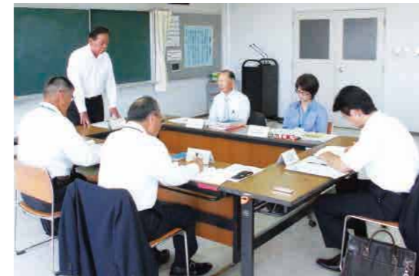
▲ 総合教育会議の様子