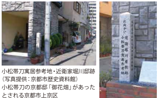
小松帯刀寓居参考地・近衛家堀川邸跡 小松帯刀の京都邸「御花畑」があったとされる京都市上京区