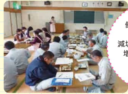
【子育て支援センターとの交流会】

子どもたちと一緒にラップでおにぎりづくり。バランスよくお弁当を詰めました。親子の食育を推進します。