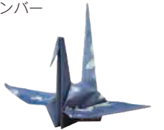
復興の思いを込めて折られた鶴