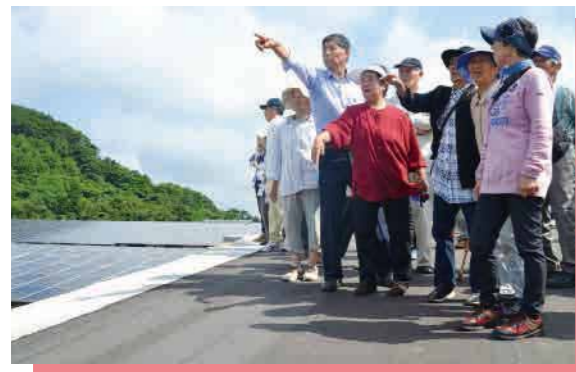
▲発電所の広さに驚く高山地区の皆さん