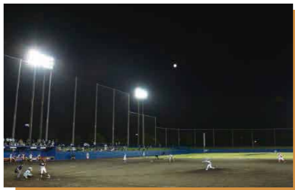
▲月の見守るなか熱戦が繰り広げられました