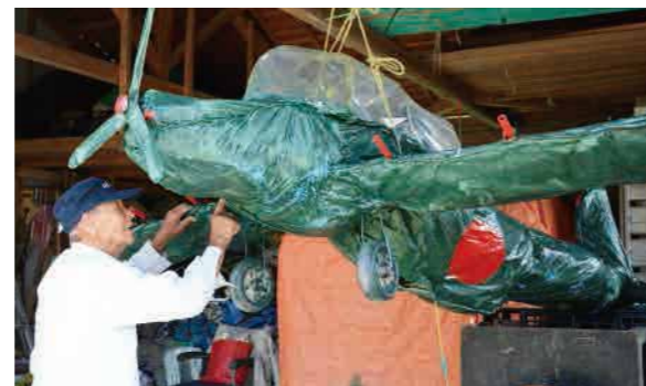
自宅の倉庫に飾られたゼロ戦模型