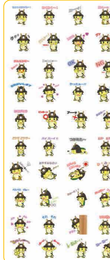
▲ 表情豊かなひお吉くんスタンプは全部で40種類

LINEスタンプとは、携帯アプリ「LINE」で使用できる、友達との会話に挿入できるイラストのことです。このスタンプはLINEアプリ上で50コイン(120円)を使用して購入することができます。この売上のうち手数料を除いた半額が日置市の収入となります。 また、LINE@公式アカウントでは日置市の行事やイベントなどさまざまな情報を配信中です。こちらもよろしくお願ひします。 友達の会話が盛り上がること間違いありません。友達とのグループトークや家族との会話の中にひお吉くんスタンプを使って日置市をPRしてみませんか?