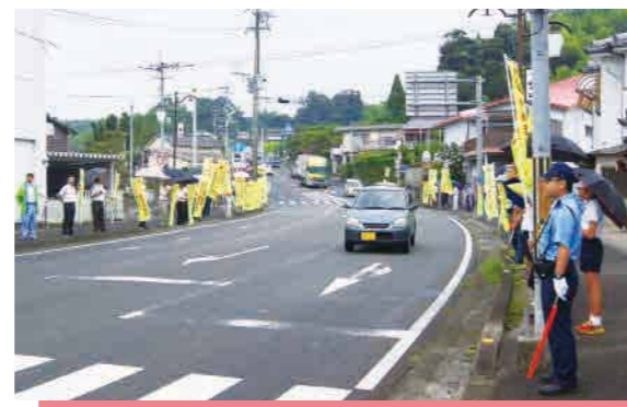
▲吹上の道沿いに交通安全を願う旗が並びます

3 月と5月に起きた吹上地域での交通死亡事故を受け、今後2度と事故が起こって欲しくないと、吹上地域で「吹上ビッグウェーブ200人立哨」がありました。当日は日置市や警察関係者のほか、吹上中学校や伊作小学校の生徒も参加。約200人が早朝の国道270号線の沿道に立ち、「高齢者、子どもを事故から守ろう」「飲酒運転追放」と書かれた黄色い交通安全の旗を持って国道を歩き交うドライバーの皆さんに交通安全を訴えました。沿道に並ぶ黄色く大きな波が、2度と事故の起こらない安全な道路を願いました。