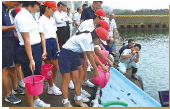
▲「大きくなーれ」と声をかけて放流します