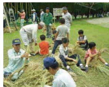
住吉地区の伝統行事「十五夜」での綱練りの伝承

皆さんの協力と連携が地区のちからとなり、そのちからこそが課題を解決し、住みやすい地区を作っていくこととなります。