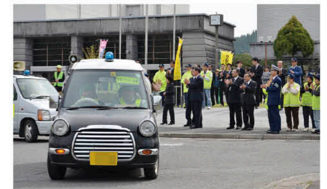
パレード隊をお見送り

春の全国交通安全運動・地域安全運動が4月6日から全国一斉にスタートするのに先立ち、市役所で日置警察署・地域防犯団体と合同の安全運動出発式が開催されました。