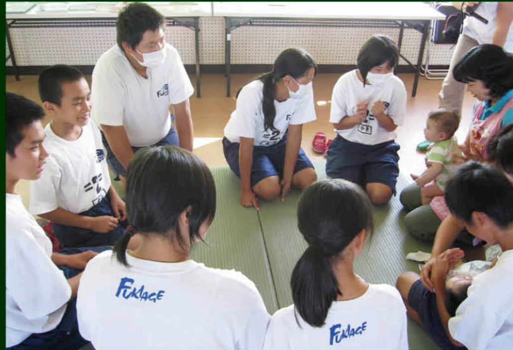
いのちふれあい教室で赤ちゃんとのふれあい

図書館でも、乳幼児から小学生・中学生、それぞれに応じた多種多様な本の収集や読書相談、おはなし会など、子どもと本をつなぐ様々な取り組みをしています。「本をいっぱい読んで身も心も大きくなあれ」と願いながら…。