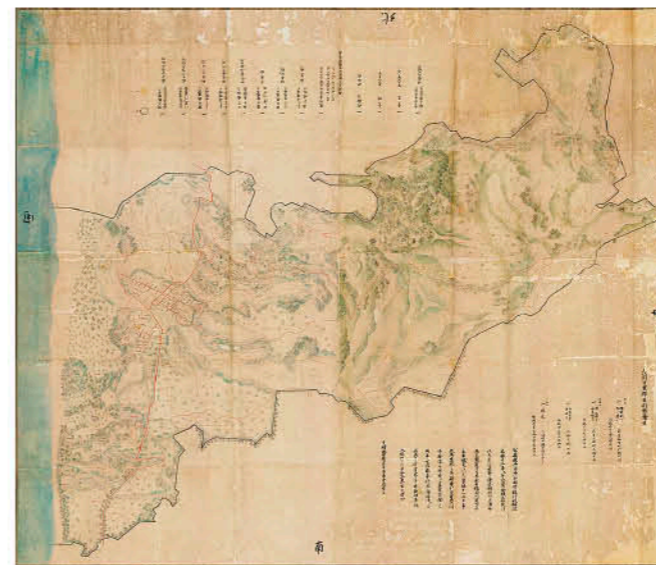
県指定文化財に指定された吉利郷惣絵図

日置市が所有する吉利郷惣絵図が県指定文化財に指定されました。吉利郷惣絵図は、昔の日吉地域吉利地区の様子を描いた絵地図です。元禄12年(1699)、吉利領主の禰寝清雄は、領地である土地を実際に調査、測量して絵地図にしましたが、長い年月で破