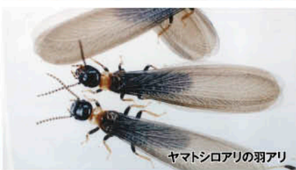
ヤマトシロアリの羽アリ