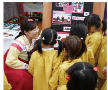
笑顔で子どもたちと交流