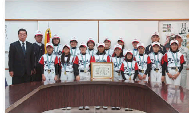
優勝を果たした日置エンジェルスの選手たち

3月27日、第39回鹿児島県ちびっこソフトボール大会女子の部で優勝した「日置エンジェルス」が、市長を訪問しました。