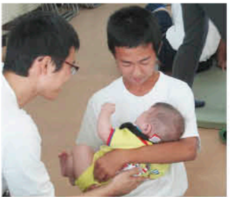
実際に赤ちゃんをだっこ