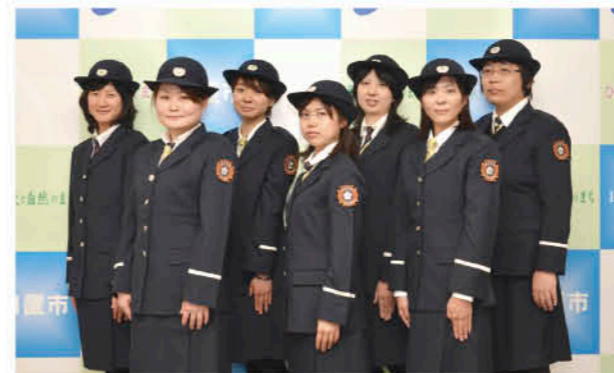
女性消防団員の方々

4月1日、日置市消防団総務班として初の女性消防団が誕生し、7人に辞令交付が行われました。