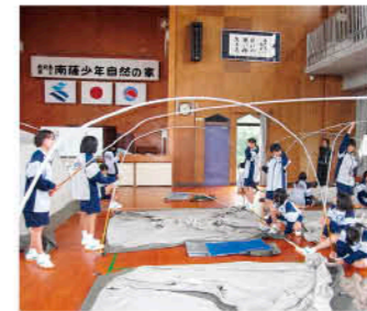
宿泊研修では自分たちでテントの組み立て

から仕事内容や職場の様子を聞くことで、職業を身近に感じ、進路選択への意欲を高める大切な活動となっています。 本校では、昨年度から「鹿児島県島県学力向上研究指定校」として、授業や家庭学習の取組の充実を図っています。具体的には授業始めの五分間テスト「吹中いろはチャレンジ」を実施。先生方は授業の共通実践事項「吹中6エッセンス」という取組を実践し、生徒に分かりやすい授業を展開しています。 今後も、吹上中学校の全ての活動に誇りを持ち、保護者や地域の方々の支えに感謝しながら頑張っていきたいと思えます。