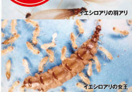
イエシロアリの羽アリ