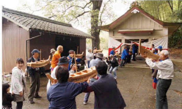
波を再現しながら手渡し