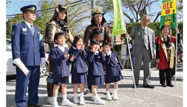
鎧武者と記念撮影

小 中学校の入学式が開催された4月8日、伊集院小学校で日置警察署・武者行列保存会・防犯協会合同の「子ども見守り活動」が実施されました。