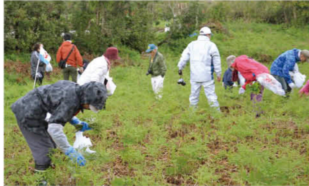
多くの方々が楽しんだ山菜狩り

尾木場地区(東市来)で4月7日、「棚田散策&山菜狩り」が行われ、日置市内をはじめ鹿児島市などから31人が参加しました。