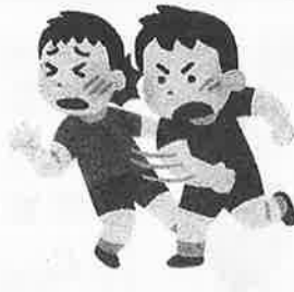
暴力行為を受けた