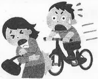
交通事故に遭った