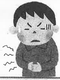
飲食店で食中毒 になった