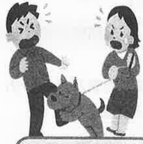
他人の飼い犬 に噛まれた