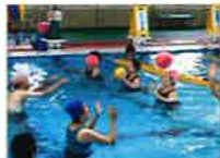
関節痛スッキリ改善予防

始めに体育館で30分間ストレッチを行った後プールで水中運動を行います。関節痛をスッキリ改善！