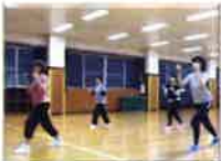
脂肪燃焼エアロビクス

音楽にあわせて楽しく運動、楽しく脂肪燃焼！夜開催の教室ですので1日の終わりにリフレッシュしませんか？