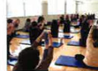
やさしいヨガ(水・金)

年代・性別・ジャンルを問わず、誰でも参加できる教室です。音楽に合わせて楽しく体を動かせます！