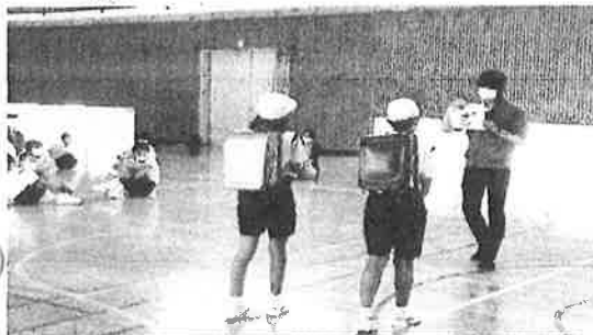
車に乗らないネ・ゲームできるよ！

上市来小学校では、5月14日に不審者対応訓練を行いました。児童は、車からの声かけと「子ども110番の家」の駆け込み、DVDで「いかのおすし講座」を視聴しました。署員より不審者に遭った時、大声を出す・防犯ブザーを鳴らす・距離を取るなどを学びました。