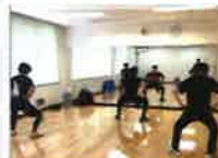
自重トレーニング

道具を使用せず、自分の体重を利用した筋力トレーニングです。筋肉をつけて代謝アップ！