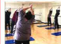
初級エアロビクス&ストレッチ

基本のステップがメインのエアロビクスと「ゆるめる・伸ばす・整える」の簡単ストレッチ体操を行います