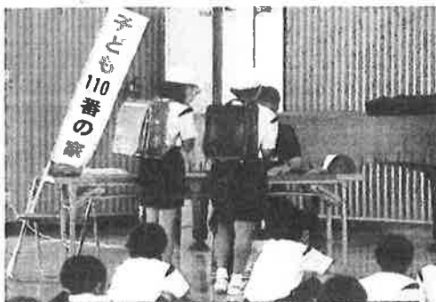
不審者の服装は・車の色は？