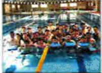
大人スイミング(火・金)

初心〜上級までグループに分かれて練習するので、初めての方も安心して参加できます！