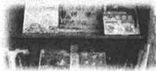
学習支援 : 英語えほんコーナー