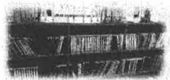
新しく『YA(ヤグ'ア'ルト)コーナー』を作りました!