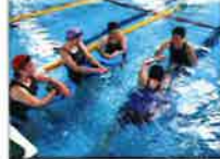
スイミー4種目泳法教室

クロールで25m以上泳げる中級者向けの教室です。より専門的な技術や知識を身につける教室です。