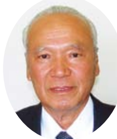
畠中 實弘 前議員 < 議員在職 10 年表彰 >