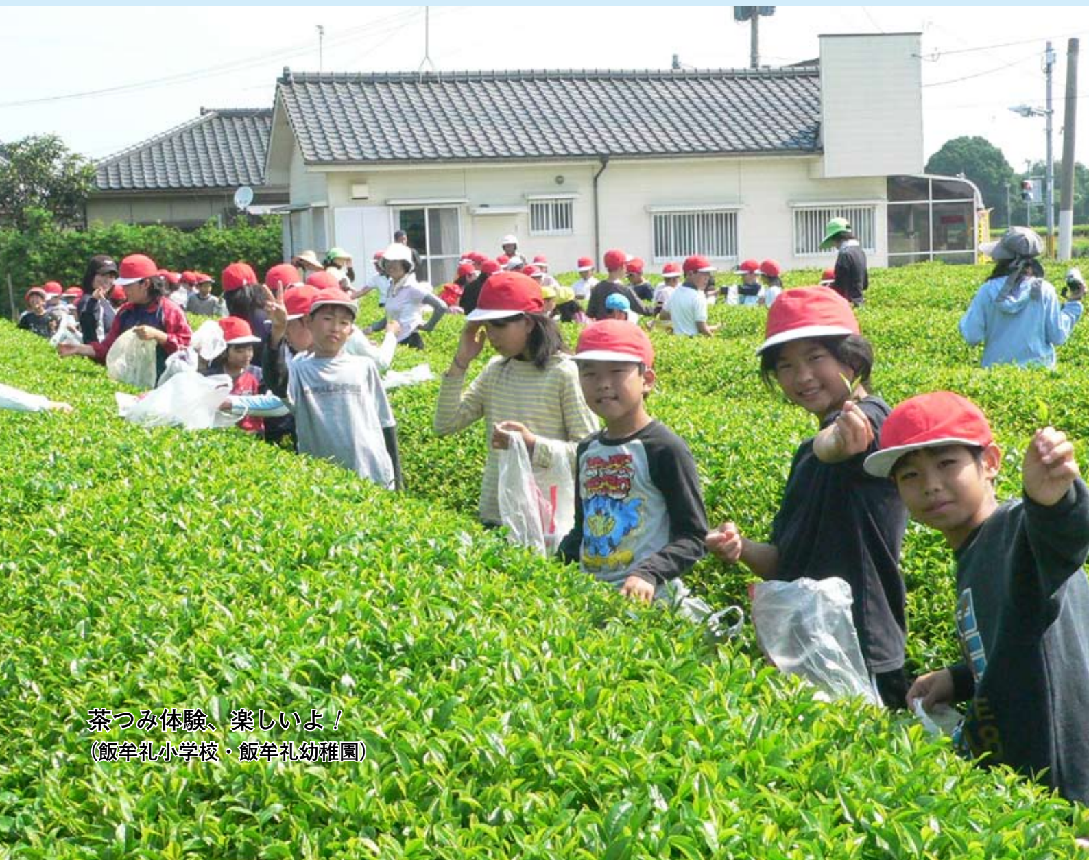
茶つみ体験、楽しいよ! (飯牟礼小学校・飯牟礼幼稚園)