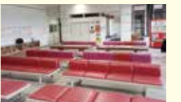
学習スペースとして期待される中央公民館ロビー

答 現在、4つの図書館で45席、増やすことは可能であり、中央公民館のロビーを検討していく。