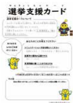
日置市の選挙支援カード

答 民主主義の根幹をなす大切な権利であるため、投票機会の確保について研究していく。