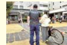
本市の外国人向け交通安全教室の様子