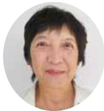
これえだ 是枝 みゆき 議員