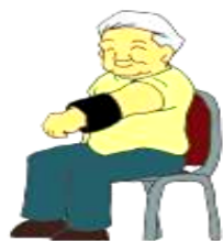
①腕を前に上げる運動