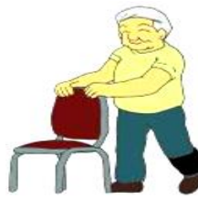
⑤脚の後ろ上げ運動