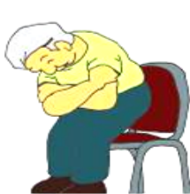
③椅子からの立ち上がり