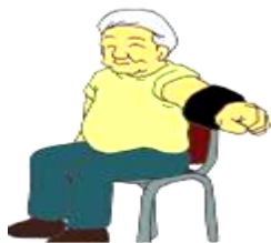
②腕を斜めに上げる運動