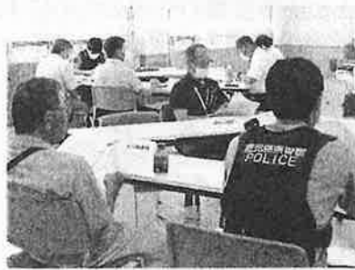
【6月】青少年育成協議会