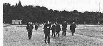
【1月】ニューイヤージョギング