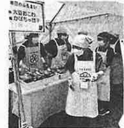
【9月】国体おもてなし (緑竹と大豆おこわ)