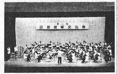
【10月】日吉地域文化祭