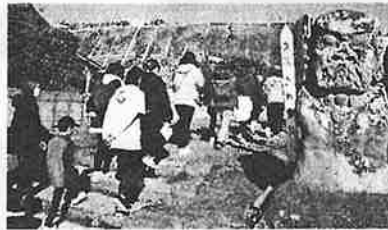
【2月】史跡めぐり歩こう会