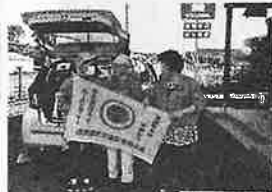
【7月】交通安全母の会