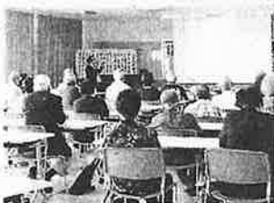
【5月】講座合同開講式