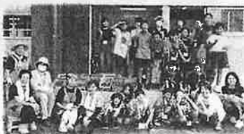
子ども会交流(BM団子づくり)