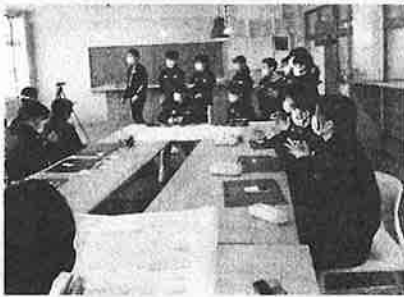
【4月】子ども会リーダー研修会