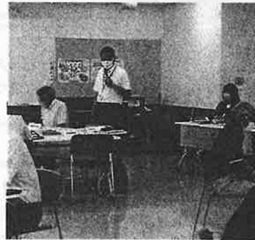
▲日吉学園校長から学校の現状報告