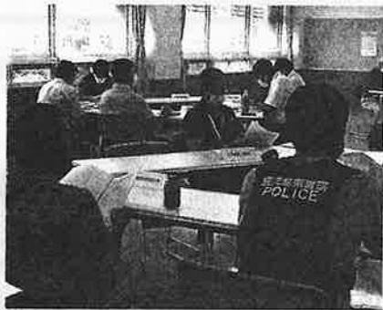
▲グループごとに情報交換

今後も「日吉地域青少年育成会議」を通して関係機関団体と連携して、青少年の健全育成に努めていきます。