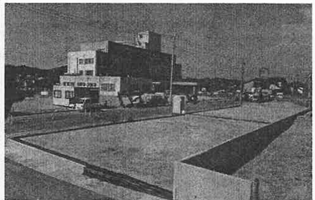
JR湯之元駅の東側の宅地造成