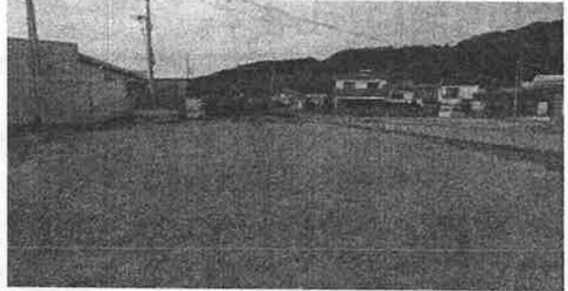
宅地整地予定地(東市来郵便局付近)

建物移転は、宅地整地と連携し、東市来郵便局周辺、JR湯之元駅周辺、国道3号と旧国道の間について、順次地権者との移転交渉を進めてまいります。