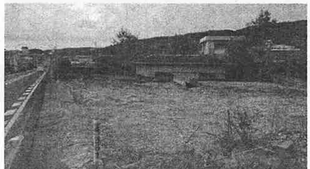
建物移転(国道3号沿い)