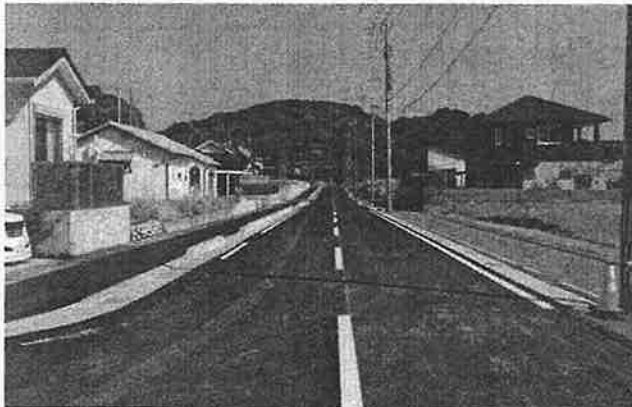
JR湯之元駅の東側の都市計画道路

令和5年度は、JR湯之元駅東側の都市計画道路および周辺の宅地造成工事を行いました。都市計画道路については、令和7年4月供用開始に向けて引き続き工事を進めてまいります。