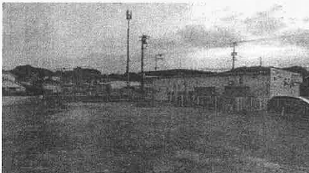
建物移転(ファミリーマート裏)

令和5年度は、建物10件、借家人1件の移転が完了しました。また、建物1件と借家人1件は、令和6年度中に移転完了の予定です。