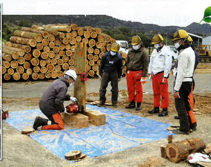
チェーンソーの安全講習 (指宿市)