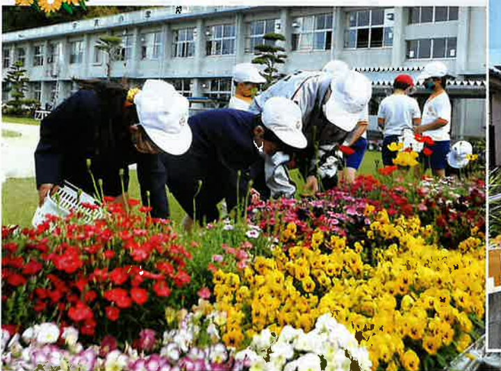
生徒による学校花壇の緑化活動（さつま町）