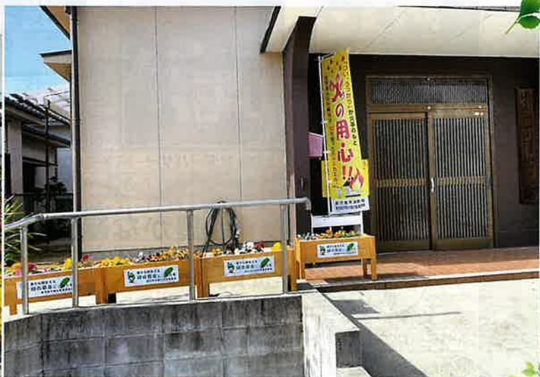
公民館等の地域緑化（鹿児島市）