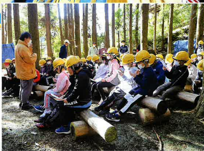
小学生への森林環境教育 (始良市)