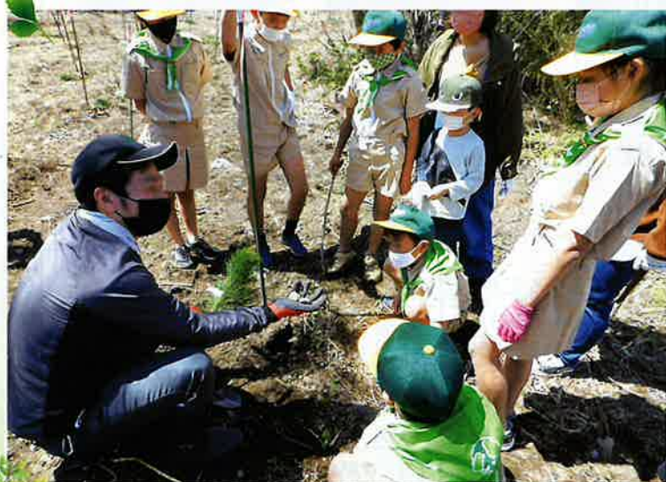
緑の少年団への植樹指導 (南九州市)