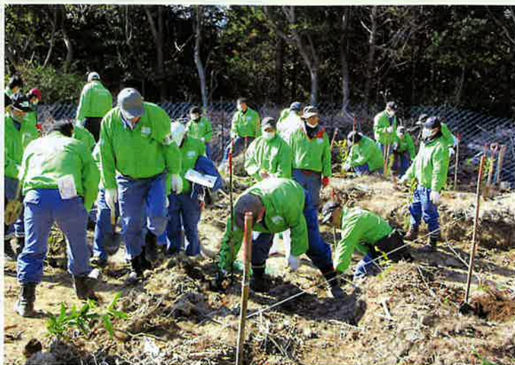
企業の森づくり活動（鹿児島市）