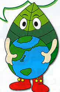
イメージキャラクター グリーン太郎

みんなで守り 育てよう、 山の命、森の恵み。 緑あふれる豊かな 地球を次世代に 引き継ぐために。