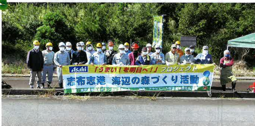
県内企業との連携による森づくり（志布志市）