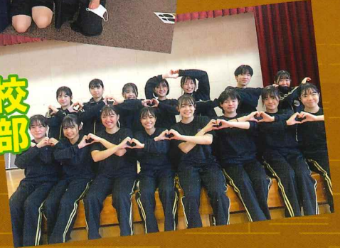
伊集院高校ダンス部