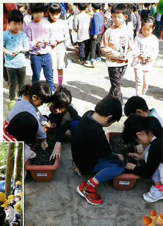
保育園・幼稚園児によるどんぐりの 種まき (鹿児島市)