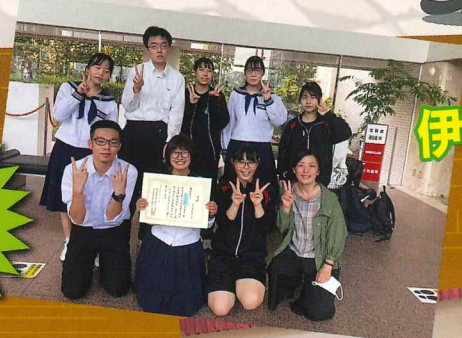
伊集院高校演劇部