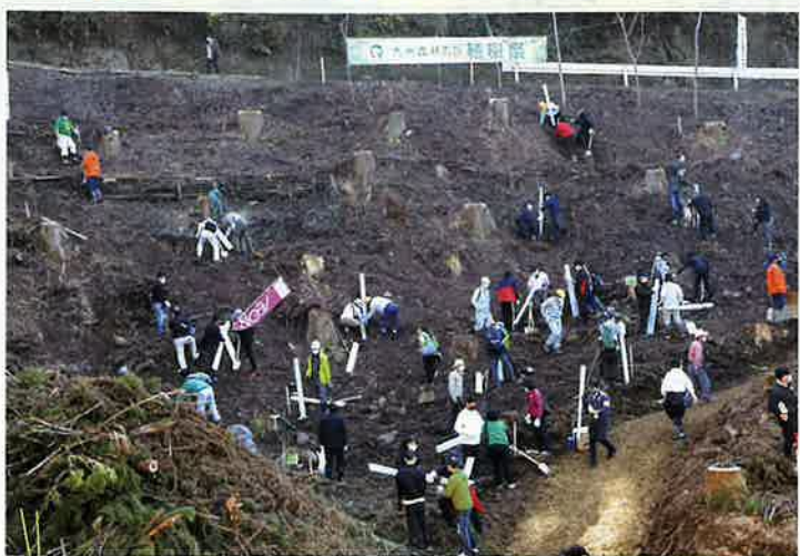
九州森林の日植樹祭（始良市）

持続可能な森づくりを目指し、企業・団体、一般県民など多様な主体による県民参加の森林づくり活動を支援しています。