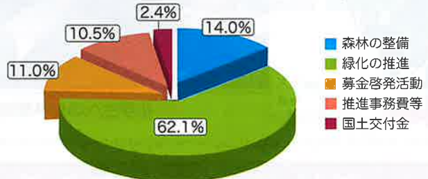
緑の募金 用途実績 令和3年度 (R3.7.1～R4.6.30)