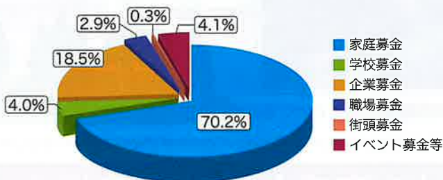
緑の募金 実績(種別) 令和3年度 (R3.7.1～R4.6.30)

県内における昨年度の募金額は62,365千円余りとなりました。 皆様からお寄せいただきました善意に心から感謝申し上げます。