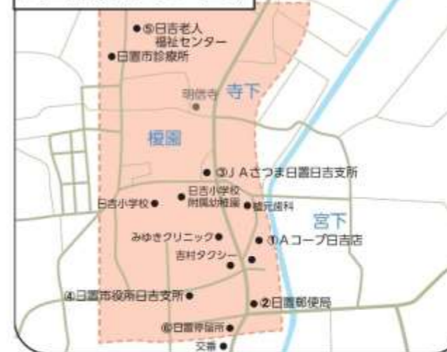
日吉市街地エリア(図1)

※次のご利用者の場合、200円となります。 ・身体障害者手帳、療育手帳、精神障害者保健福祉手帳提示者 ・運転経歴証明書、運転免許自主返納書提示者 ・小学生、中学生 ※未就学児は無料。