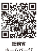
総務省ホームページ