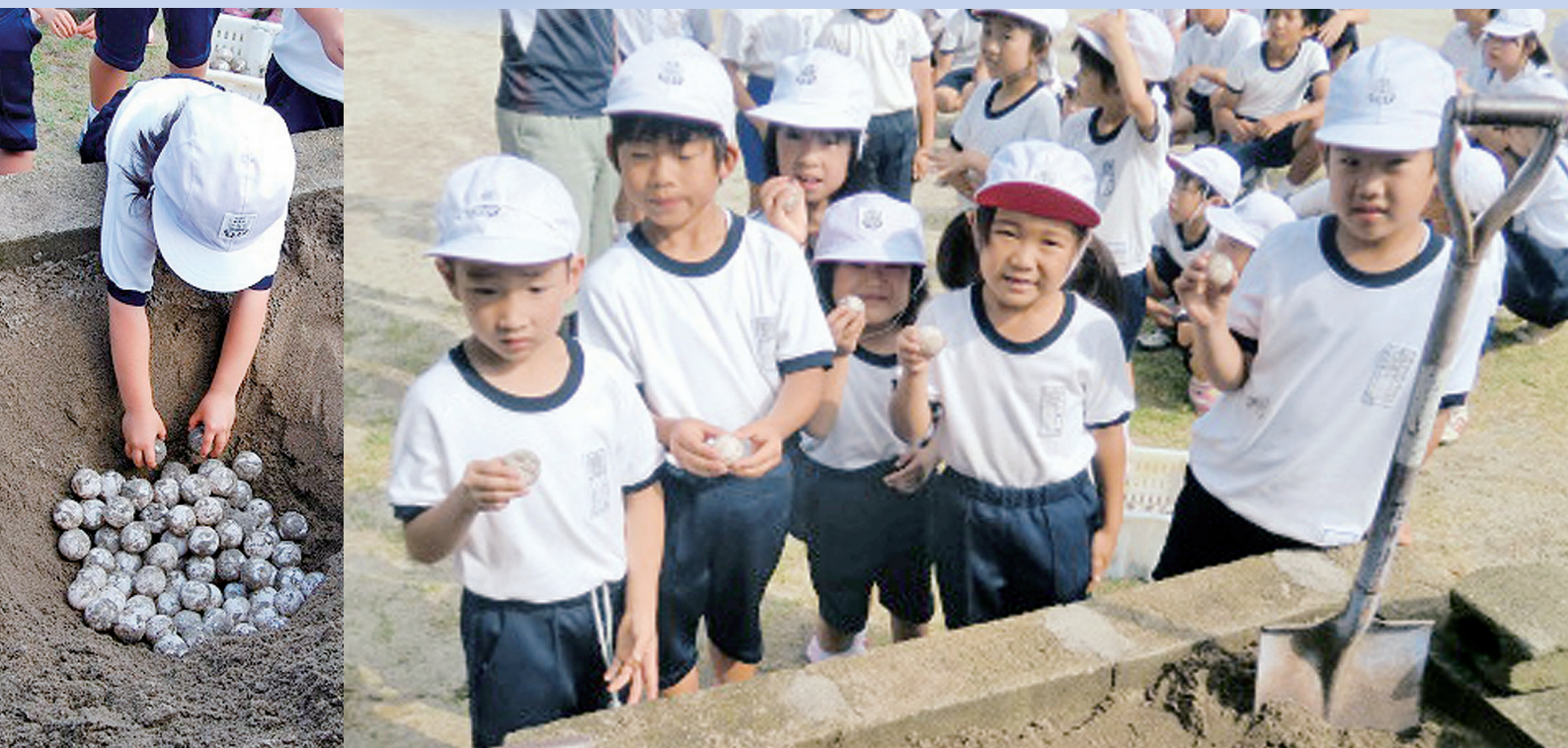
ウミガメさん元気に生まれてきてね（花田小学校ウミガメの卵の移植）

発行/日置市議会 編集/議会広報編集委員会 〒899-2592 鹿児島県日置市伊集院町郡一丁目100番地 TEL(099)248-9435/FAX(099)273-3063 http://www.city.hioki.kagoshima.jp