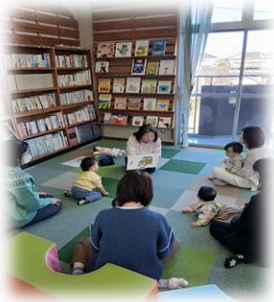
赤ちゃんの遊びとおはなしのかい

今後も「わたし自身」として、参加できる講座を企画していきますので、ぜひご参加ください。