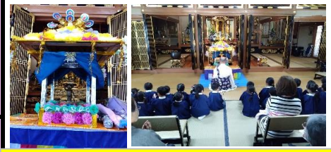
花まつり 4/18にありました。花御堂の中のお釈迦様に甘茶をかけました。