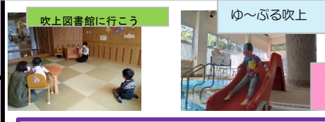
吹上図書館に行こう ゆ〜ぶる吹上